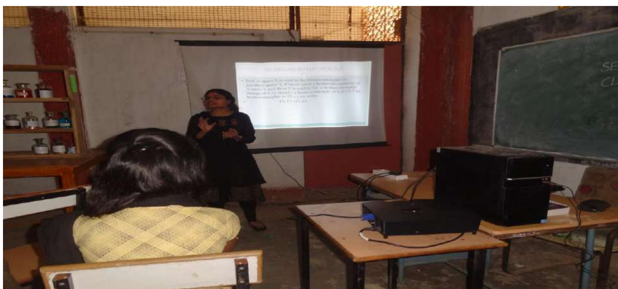
STUDENT SEMINAR THROUG POWER POINT PRESENTATION