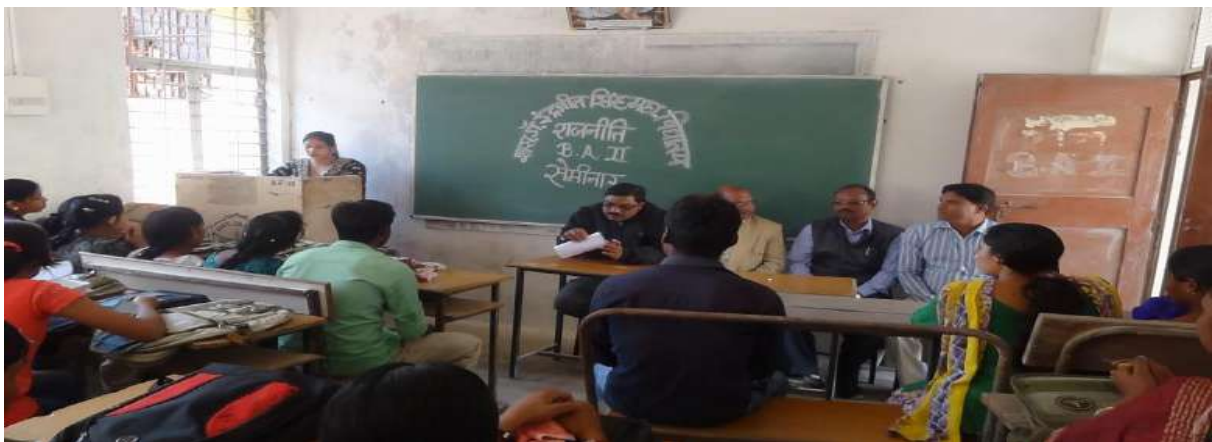
POLITICAL SCIENCE DEPARTMENT